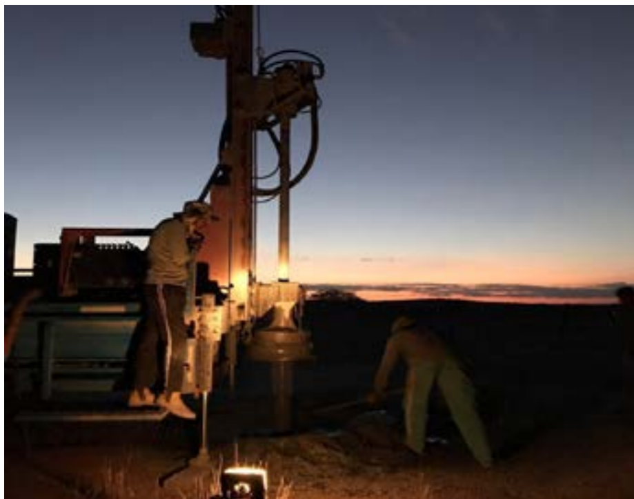
Perfuração dos poços durante dia e noite